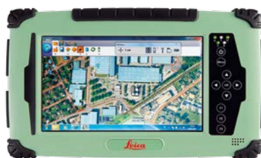
CS25 - TODAS LAS VARIANTES