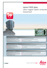
Leica CS25 plus