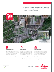
Leica Zeno Field & Office