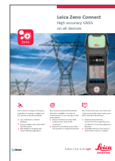
Leica Zeno Connect