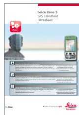
Leica Zeno 5

Microsoft, Windows® y el logo de Windows son todas ellas marcas registradas de Microsoft Corporation en los Estados Unidos de América y/o en otros países.